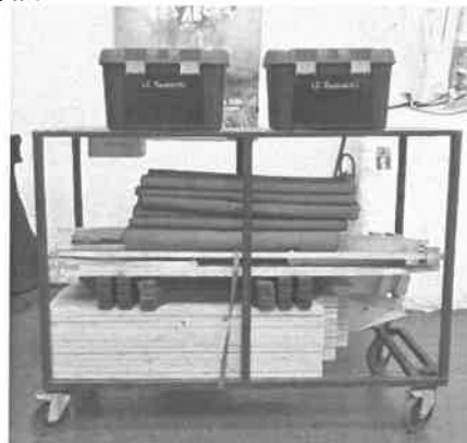
Figure 1 : un module du kit à gauche, l'ensemble du kit sur son chariot de transport à droite