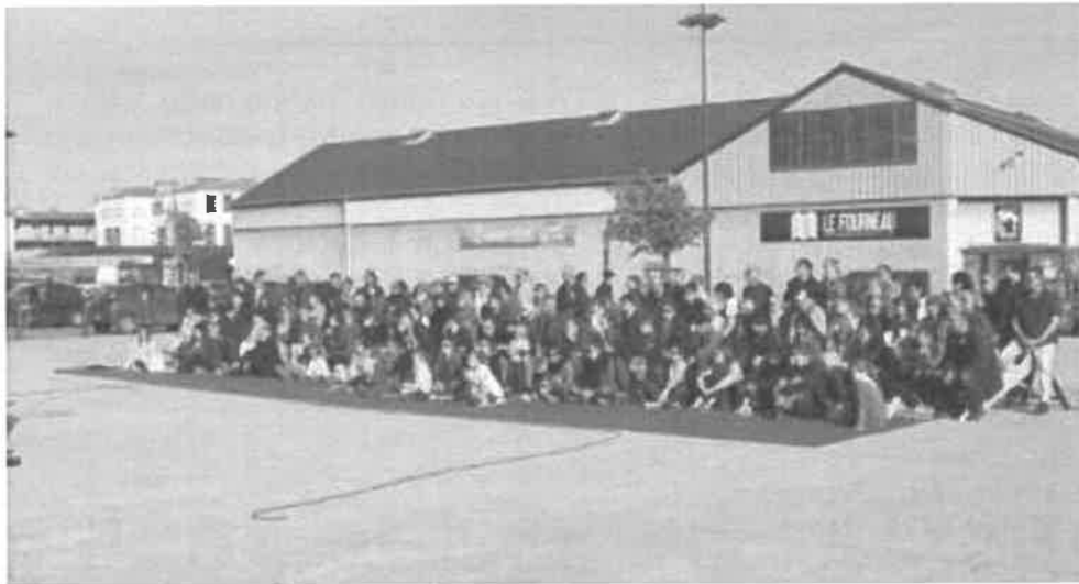
Figure 2 : Disposition du public sur un kit installé