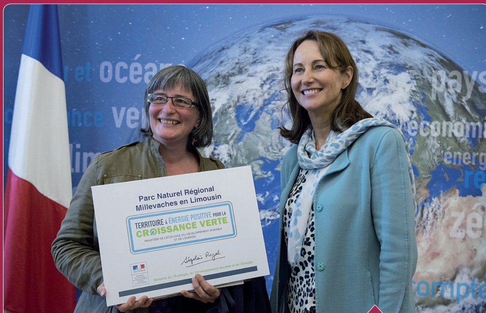
Remise du label Territoire à Énergie Positive au Parc naturel régional

intergénérationnelle, la Communauté de communes Bugeat-Sornac pour rénover la ressourcerie de Peyrelevade et bien d'autres projets aussi nombreux que divers. Avec