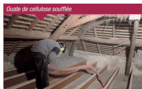
Ouate de cellulose soufflée

Entre des travaux réalisés sans artisan et sans garantie de qualité et des chantiers confiés entièrement à une entreprise, « ISOLE TOIT, mais pas tout seul » propose une solution intermédiaire : l'auto-réhabilitation accompagnée. La possibilité est donc offerte aux particuliers de réaliser tout ou partie de leurs travaux eux-mêmes avec les conseils d'un professionnel.