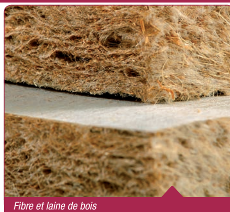
Fibre et laine de bois

→ Les matériaux biosourcés sont à l'honneur