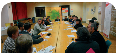
Réunion inter-territoires du PCET

En septembre 2012, le PNR et le territoire du Beaujolais Vert (territoire rural situé au nord-ouest du département du Rhône) se sont rencontrés autour de trois thématiques dans le cadre du Plan Climat Energie Territorial :