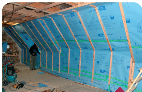
Exemple de chantier de rénovation intérieure

PACT Creuse 2, rue des Marronniers 23000 GUERET ☎ 05 55 52 46 67 ☎ 05 55 52 85 99 ✉ cal-pact-creuse@pactarim.net