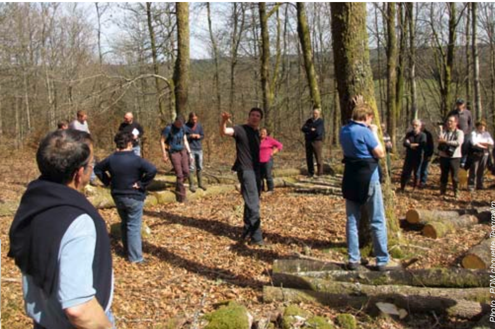
Journée d'information sur la prise en compte de la biodiversité dans les travaux forestiers, le 7 avril 2014, sur la Montagne de Bay, commune de Pérols-sur-Vézère.

Animé par le Centre régional de la propriété forestière (CRPF) du Limousin depuis deux ans, le Plan de développement de massif (PDM) Chouette de Tengmalm arrive à son terme. Petit bilan.