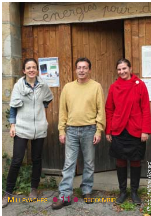
MILLEVACHES ● 11 ● DÉCOUVRIR